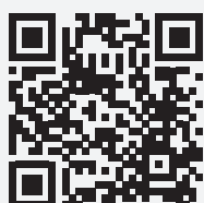
Vidéo de présentation RD8-20