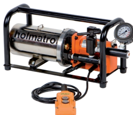
Pompe EHW1650RC avec option 3